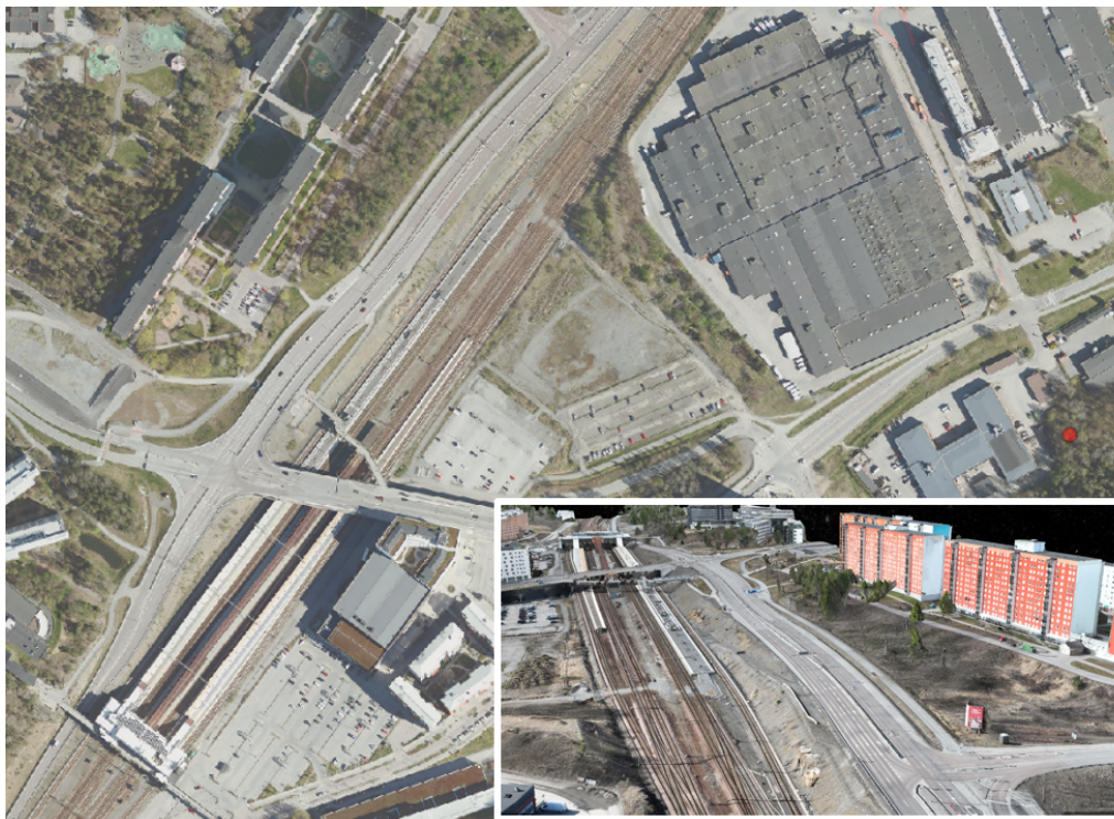
Ortofoto och snedbild över Flemingsberg och Huddingevägen

Mellan åren 2010 och 2020 fattades flera stora beslut om infrastrukturåtgärder i och kring Flemingsberg som fått följdverkningar på dagens situation och möjlighet till lösning. Dels togs en vägplan fram för Tvärförbindelse Södertörn (fastställd 2022 och laga kraft 2024), dels slöts överenskommelse inom Sverigeförhandlingen om att bygga Spårväg syd mellan Flemingsberg och Älvsjö via Kungens kurva Skärholmen.